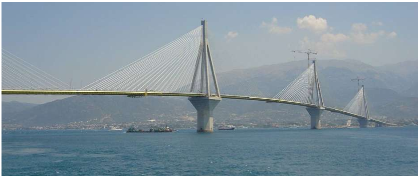
Pont de Rion-Antirion en Grèce, mis en service en 2004, d'une longueur totale de 2880 m, avec des portées de 286 m et 560 m (1999-2004)

Un des grands projets en cours est le pont de Messine, pont suspendu, reliant la Sicile et l'Italie. Sa longueur totale sera de 5070 m avec une portée principale de 3300 m. Il a été calculé pour résister à des vents de 215 km/h et un séisme de 7.1 sur l'échelle de Richter. Sa construction a commencé en 2006 et sa mise en service est prévue en 2012.