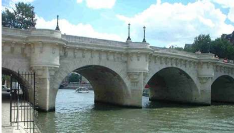
Paris, Pont Neuf achevé en 1606

La pierre et la maçonnerie furent utilisées pour des ouvrages importants et durables, depuis la haute Antiquité jusqu'à la fin du XIXe siècle. La pierre a de bonnes caractéristiques mécaniques en compression, mais résiste peu à la traction. Les ouvrages sont donc constitués en arcs, en voûtes, permettant ainsi une bonne utilisation des performances de ce matériau (celui-ci étant alors en compression uniquement), mais ce procédé limite la distance (portée) entre appuis (piles), de l'ordre de 50 mètres.