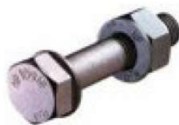
Vis et écrou