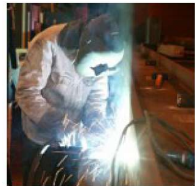
Assemblage par soudure