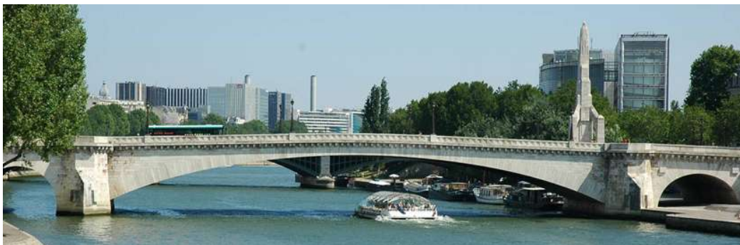
Pont de la Tournelle (Paris), pont en arc encastré d'une longueur totale de 120 m , début de la construction en 1928 et inauguré en 1930.

C'est au XIXème siècle, en 1845, que la formulation du béton est mise au point (mélange de granulats, de sable, de ciment et d'eau dans des proportions précises). Vint ensuite le béton armé (association d'armatures en acier au béton), puis le béton précontraint. Une nouvelle famille de pont apparaît alors. Les caractéristiques mécaniques du béton armé font que l'on construit des ponts en arcs, mais avec des portées plus importantes que les ponts en maçonnerie, de l'ordre de 100 m.