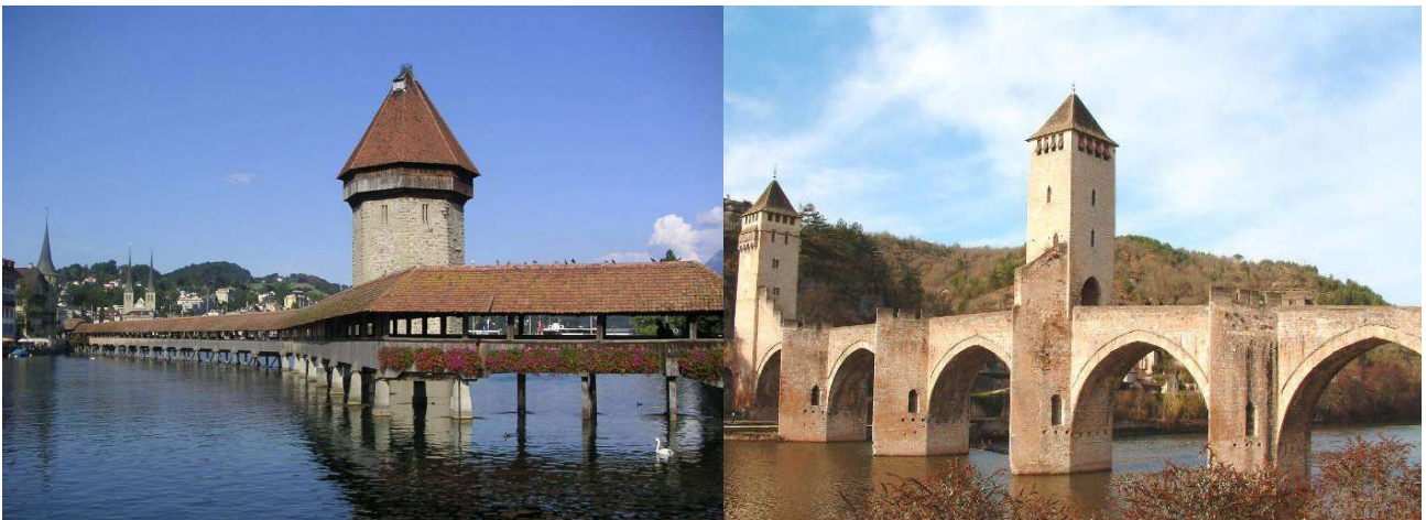
Le pont de la Chapelle à Lucerne (Suisse), construit en 1365.

La pierre a de bonnes caractéristiques mécaniques en compression, mais résiste peu à la traction. Les ouvrages sont donc constitués en arcs, en voûtes, permettant ainsi une bonne utilisation des performances de ce matériau (celui-ci étant alors en compression uniquement), mais ce procédé limite la distance (portée) entre appuis (piles), de l'ordre de 50 mètres.