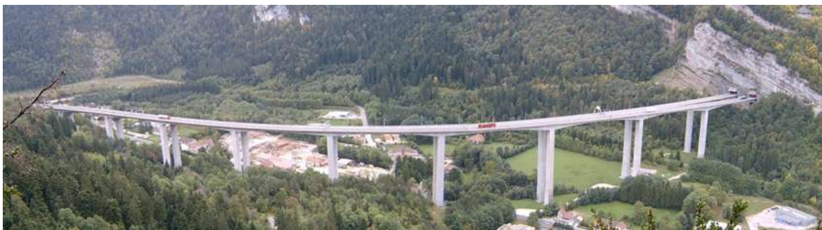
Viaduc de Nantua, ouvrage sur l'A40, inauguré en 1988.