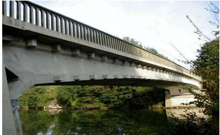
Pont de Luzancy sur la Marne, commencé en 1941 et inauguré en 1946. Pont à bédouilles d'une portée de 55 m. C'est l'un des premiers grands ouvrages de Eugène Freyssinet en béton précontraint.

C'est en 1928, qu' Eugène Freyssinet, met au point le béton précontraint. Son principe consiste à comprimer le béton de la structure par des câbles fortement tendus, afin de pallier à la faiblesse du béton à la traction. Ce procédé va permettre d'alléger la structure et donc d'augmenter les portées des ponts en béton. De nouveaux types de ponts font leur apparition, ainsi que de nouvelles méthodes de construction.