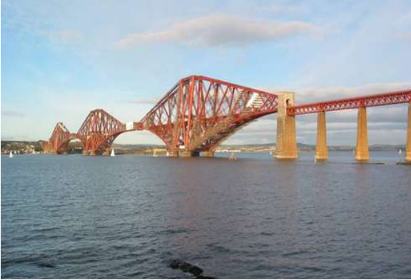
Pont du Firth of Forth (Écosse), réalisé en 1890, avec deux travées de 521 mètres.

L'acier, avec de très bonnes caractéristiques mécaniques et qui fut mis au point vers 1867, va permettre d'accroître les performances des ponts et amener des structures beaucoup plus légères. L'un des grands ingénieurs français de cette époque est Alexandre Gustave Eiffel (1832 -1923).