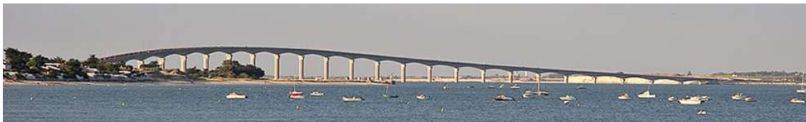
Pont de l'Île de Ré, inauguré en 1988. La longueur totale de l'ouvrage est de 2927 m, avec des portées de 110 m.

Grâce au béton précontraint, de nouvelles méthodes de construction ont été mises en oeuvre, permettant la réalisation de ponts en béton dans des zones géographiques difficiles, et avec des formes légères.