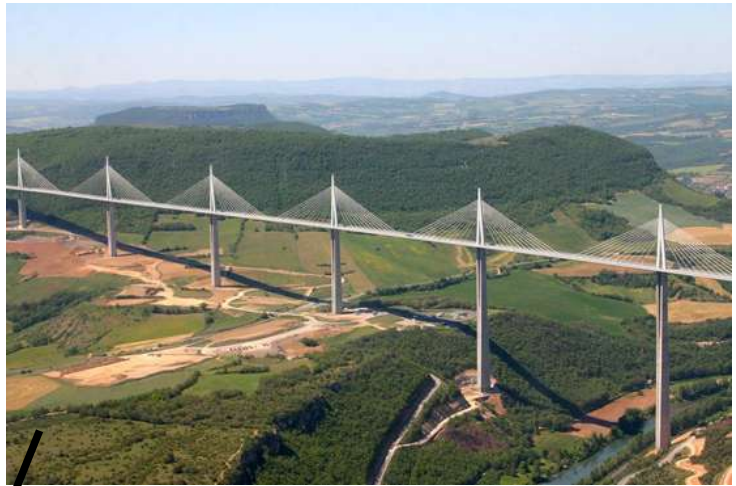
Viaduc de Millau, pont à haubans d'une longueur totale de 2460 m, avec des portées de 204 m et 342 m (2001-2004).