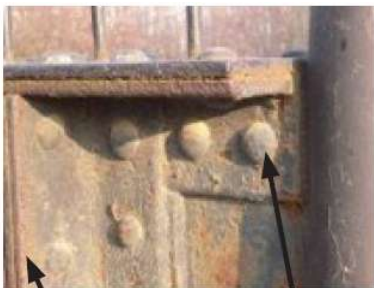
Plaque contre-joint rivet

Les techniques de fabrication de l'acier évoluent rapidement de même que les modes d'assemblages. Les éléments métalliques étaient assemblés par rivetage et plaques couvre-joint. Ce mode d'assemblage s'avère long et cher. Une autre méthode est alors mise au point et en oeuvre : l'assemblage par soudure. C'est actuellement le procédé le plus utilisé. Toutefois des assemblages par boulons (vis et écrou) sont effectués pour certains éléments.