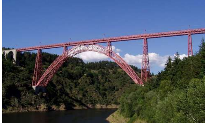
Pont viaduc de Garabit (Cantal), achevé en 1884 avec une portée de 165 mètres.

Les techniques de fabrication de l'acier évoluent rapidement de même que les modes d'assemblages. Les éléments métalliques étaient assemblés par rivetage et plaques couvre-joint. Ce mode d'assemblage s'avère long et cher. Une autre méthode est alors mise au point et en oeuvre : l'assemblage par soudure. C'est actuellement le procédé le plus utilisé. Toutefois des assemblages par boulons (vis et écrou) sont effectués pour certains éléments.